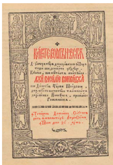
Foto 1. Carte românească de învățătură , foaia de titlu a ediției din 1646 în grafie chirilică

Cercetările științifice atestă că limba vorbită de populația majoritară a republicii este limba română . Amintim, că deja în primul Cod de legi al Țării Moldovei, promulgat de domnitorul Vasile Lupu în 1646 și editat la Iași, chiar pe copertă era menționat că acest monument de drept al Principatului a fost elaborat în limba românească cu titlul: Carte românească de învățătură de la Pravilele împărătești și de la alte giudeațe cu dzisa și cu toată cheltuiala lui Vasilie Voievodul și Domnul Țării Moldovei di în multe