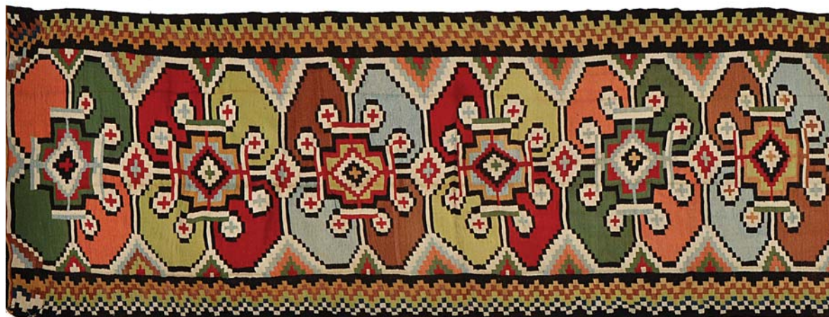
Păretar, motivul Prescure , începutul sec. al XIX-lea. Nr. 425